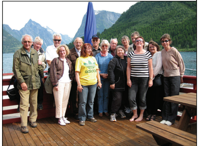
Her er trappen etter Riisefonna hadde tatt huset Alle deltakerne samlet