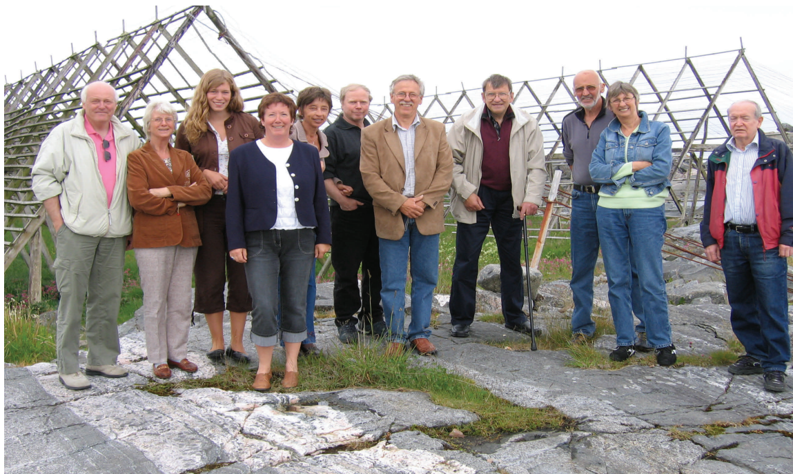
Her ser vi deltakerne samlet å på berga.

Søndagen kikket vi oss rundt i området med de mange holmene, blant annet såg vi Hestskjæret fyr. En opplevelserik helg i spesiell natur.