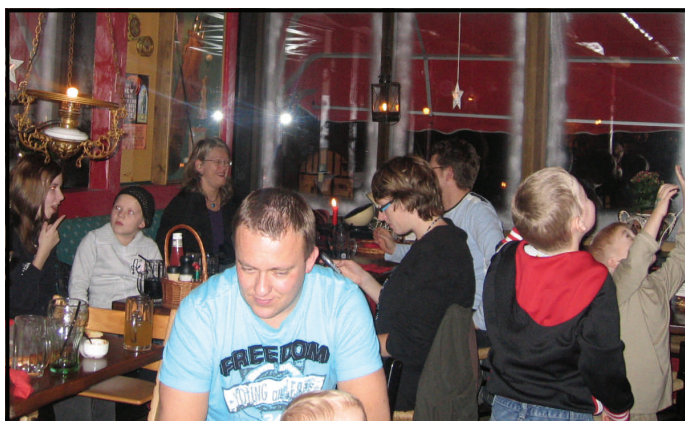
Etterpå ble det besøk hos Peppes Pizza

Velferdssekretæren og Daglig leder ønsker alle en riktig GOD JUL og GODT NYTTÅR