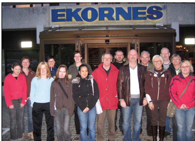
Alle deltakerne samlet utenfor fabrikk

Etter omvisningen så gikk til cafeen på fabrikk og kjøpte mat. Mange sa det var billig mat der.