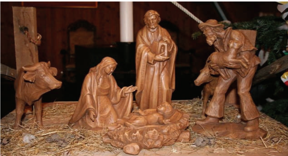
Fra julekrybben i Volsdalen kirke

I det stille til de små bringer Jesus håp og fred, og han kommer da som nå fra sin himmel til oss ned. Julenatt med lys og glede minner oss om Gud som kom. Evig er han her tilstede, nå står grav og krybbe tom. (Bjørn Eidsvåg)