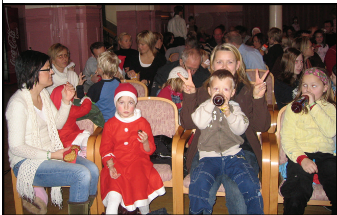
Ungene venter på forestillingen skal begynne

Vi vil ønske dere alle en riktig god jul og godt nyttår !!