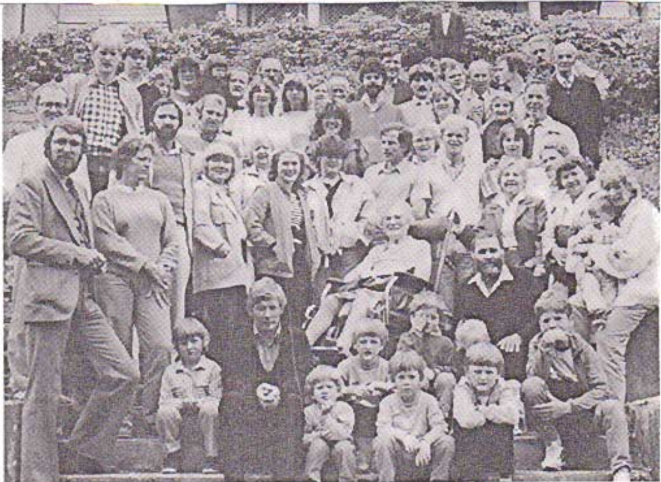
De glade stevnedeltakerne fra Trondheim og Møre og Romsdal samlet utenfor Knausen Hotell.