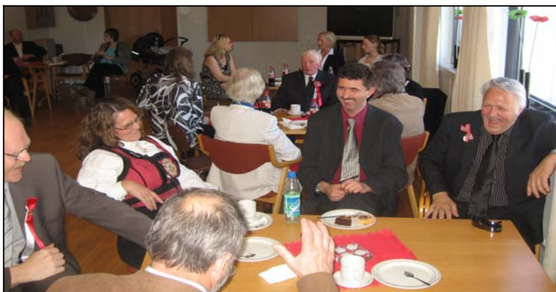
Tydeligvis munter stemning rundt dette bordet